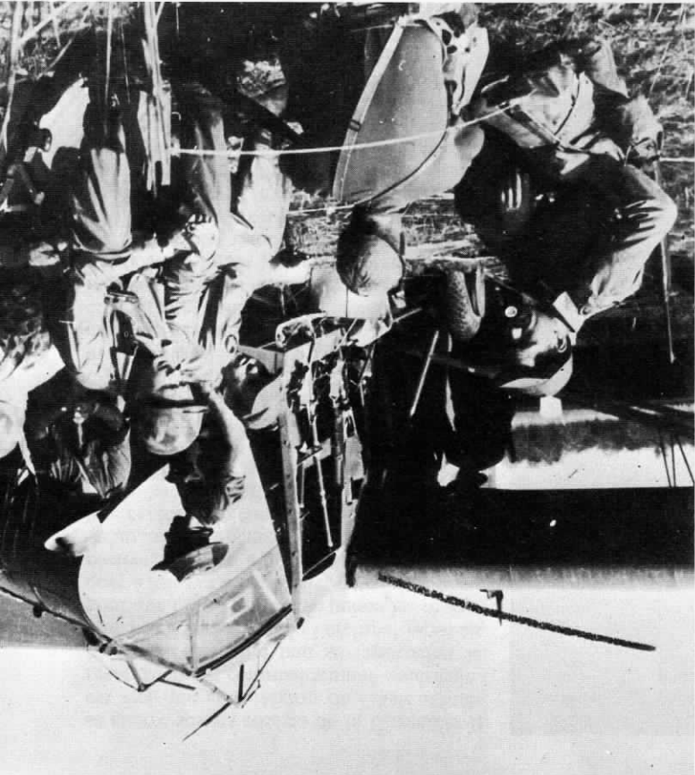
1 - Le major général Wingate en conversation avec l'empereur d'Ethiopie Halle Slassie en janvier 1941. De février à mai 1941, Wingate s'attaqua aux communications italiennes; la Gideon Force qu'il commandait était constituée de partisans éthiopiens encadrés par des officiers britanniques.

leur donnerait toute la Birmanie au nord du 24 e parallèle. Le vrai problème était que personne ne voulait de ce territoire. Une solide défense de l'Inde était l'exigence stratégique unique des Britanniques. Le feu japonais ne pouvait être éteint que par des officiers britanniques. Wingate s'attaqua aux communications italiennes; la Gideon Force d'Ethiopie Halle Slassie en janvier 1941. De février à mai 1941, le major général Wingate en conversation avec l'empereur qu'il commandait était constituée de partisans éthiopiens encadrés par des officiers britanniques. 2 - Broadway, au lendemain du débarquement aérien des 5 et 6 mars 1944. Derrière les soldats du génie américain attendant de construire une piste, on distingue un planeur Waco CG-4A; 35 planeurs sur 61 réussirent à se poser à Broadway.