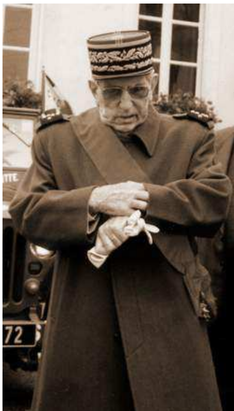
Le général Massu en 1996.

Le Général Massu s'est éteint samedi 26 octobre dernier à l'âge de 94 ans en son domicile du Loiret .Fils d'officier, il est né en 1908à Chalons sur Mame. Il entre au Prytanée militaire de 1926 à 1928, puis à Saint Cyr dont il sort sous-lieutenant en 1930 - promotion "Maréchal Foch" et choisi l'infanterie coloniale.Il sert au 16° Régiment de Tirailleurs Sénégalais à Cahors avant de rejoindre le 5° RTS au Maroc Lors des combats de Tafilalet où il gagne sa première citation.